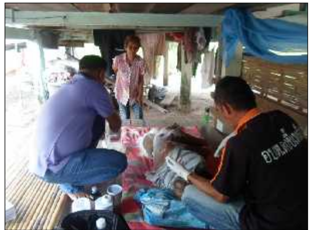
ภาพ : การลงตรวจพื้นที่เพื่อตรวจเยี่ยมผู้พิการ เพื่อให้บริการด้านสาธารณสุข การแพทย์เบื้องต้น