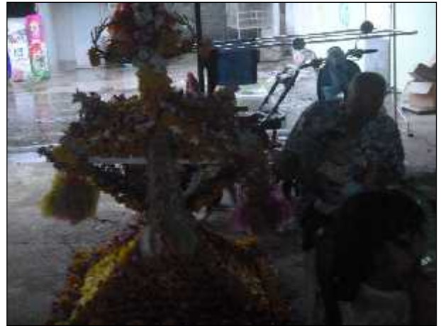
ภาพ : การอนุรักษ์ประเพณีการแห่ปราสาทผึ้ง วัฒนธรรมอันดีงามในพื้นที่เพื่อดำรงไว้

นโยบายในด้านการส่งเสริมสุขภาพและด้านอนามัยของประชาชน ได้มุ่งเน้นการพัฒนาคนให้มีความสมบูรณ์ทั้งทางร่างกายและจิตใจ รวมทั้งสติปัญญา ซึ่งเป็นรากฐานในการเสริมสร้างความเข้มแข็งและยั่งยืนให้กับสังคม และประเทศชาติ โดยได้ดำเนินงานร่วมกับสถานีอนามัยในพื้นที่ในการให้บริการตรวจสุขภาพและให้ความรู้เรื่องสุขภาพของผู้สูงอายุในเขตพื้นที่สนับสนุนการดำเนินงานของชมรมอาสาสมัครสาธารณสุขชุมชน เพื่อร่วมประสานงานกับองค์การบริหารส่วนตำบลในการให้บริการด้านสุขภาพแก่ประชาชน โครงการให้ความรู้แก่อาสาสมัครสาธารณสุขชุมชน โครงการอบรมฟื้นฟูประสิทธิภาพการปฏิบัติงานของ อสม. เตรียมความพร้อมรับสถานการณ์โรคไข้หวัดนก การดำเนินการพ่นหมอกควันเพื่อกำจัดยุงลาย อันเป็นการป้องกันและควบคุมโรคไข้เลือดออกไม่ให้ระบาดในชุมชน รวมทั้งการจัดงานแข่งขันกีฬาเพื่อรณรงค์ต่อต้านเพื่อแก้ไขปัญหายาเสพติดในชุมชน และสนับสนุนงบประมาณให้กับศูนย์ปฏิบัติการต่อสู้เพื่อเอาชนะปัญหาเสพติดอำเภอเมืองปราจีนบุรี