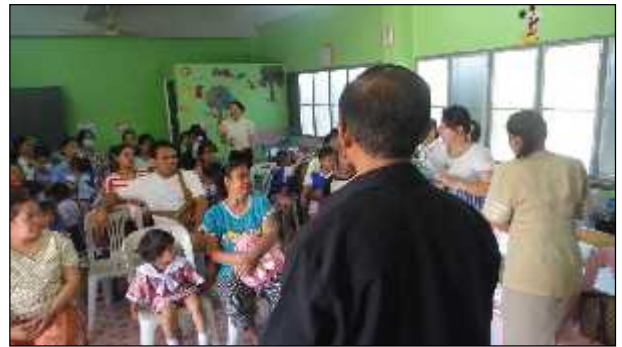
ภาพ : การมอบอุปกรณ์การเรียนการสอนศูนย์พัฒนาเด็กเล็กชุมชนวัดหนองจวง

ด้านการส่งเสริมการกีฬาและนันทนาการ ได้มีการดำเนินโครงการ เช่น กิจกรรมวันเด็กแห่งชาติ จัดการแข่งขันกีฬาประชาชน (ดงขี้เหล็กเกมส์) สนับสนุนการแข่งขันกีฬาอำเภอเมืองปราจีนบุรี สนับสนุนงบประมาณในการจัดซื้ออุปกรณ์กีฬาให้หมู่บ้านทั้ง 14 หมู่บ้าน สนับสนุนค่าใช้จ่ายในการส่งนักกีฬาเข้าร่วมการแข่งขันกีฬาระดับอำเภอ