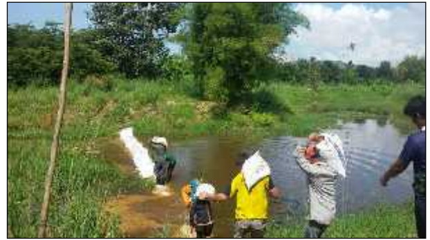
ภาพ : โครงการจัดทำฝายทดน้ำเพื่อการเกษตรในช่วงฤดูแล้ง ประจำปี 2557