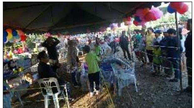
ภาพ : กิจกรรมงานวันเด็กแห่งชาติประจำปี 2557

และนโยบายด้านส่งเสริมพัฒนาเด็กเล็กในศูนย์พัฒนาเด็กเล็กทั้ง 3 ศูนย์ในสังกัดขององค์การบริหารส่วนตำบลงิ้วเหล็ก ได้ให้การสนับสนุนด้านอุปกรณ์การเรียนการสอนให้แก่เด็กทุกคนที่สมัครเข้าเรียนในต้นปีการศึกษา