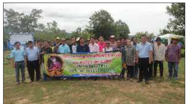
ภาพ : โครงการปลูกป่าเฉลิมพระเกียรติ 81 พรรษา มหาราชินี ประจำปี 2557