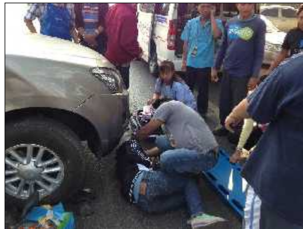
ภาพ : การให้บริการแพทย์ฉุกเฉินในกรณีที่เกิดเหตุด่วน เข้าช่วยเหลือได้อย่างทันท่วงที