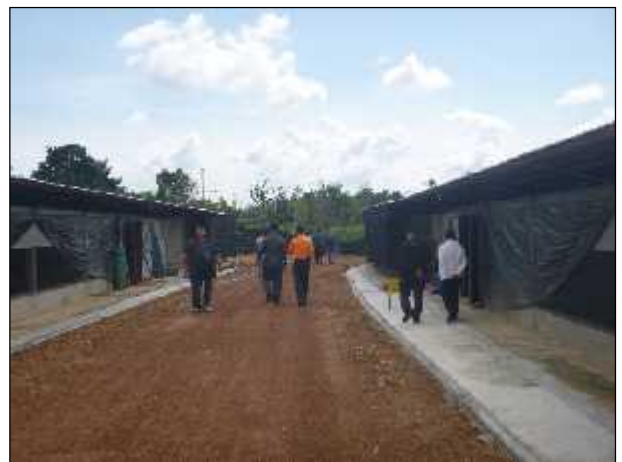
ภาพ : การร่วมลงตรวจพื้นที่กับสาธารณสุขจังหวัด ปศุสัตว์อำเภอ เจ้าหน้าที่ตำรวจจาก สภ.เมืองฯ และผู้นำท้องที่ท้องถิ่น