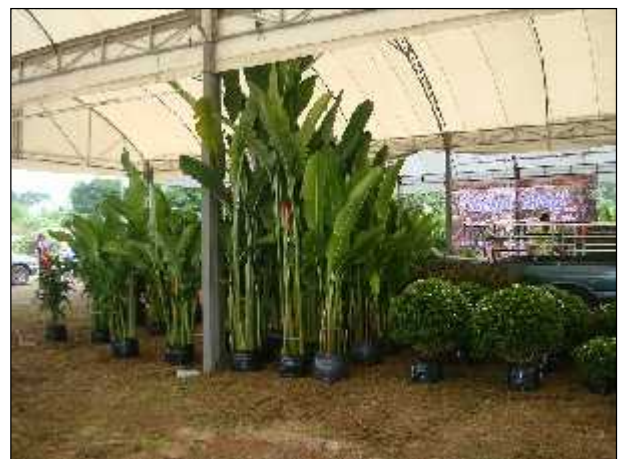
ภาพ : โครงการไม้ล้อม ไม้ใหญ่ พืชพรรณสมุนไพร บ้านดงบัง ประจำปี 2557