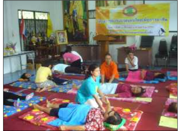
ภาพ : การฝึกอบรมตามโครงการนวดแผนไทย ตามนโยบายพัฒนาอาชีพให้แก่กลุ่มสตรีแม่บ้าน