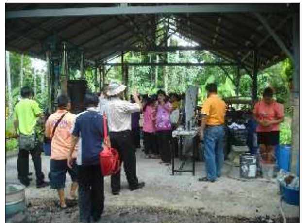
ภาพ : การต้อนรับคณะศึกษาดูงานจากหน่วยงานท้องถิ่นต่างๆ ในพื้นที่ ม.8 หมู่บ้านเศรษฐกิจพอเพียง

การพัฒนาด้านศึกษา ได้มุ่งเน้นการพัฒนาการศึกษาทั้งการศึกษาในระบบ การศึกษานอกระบบ ตลอดจนให้ความสำคัญกับการพัฒนาการศึกษาตามอัธยาศัย เพราะเชื่อว่า การศึกษาทั้ง 3 รูปแบบ นั้นมีความสำคัญไม่ยิ่งหย่อนไปกว่ากัน เนื่องจากการศึกษาจะต้องเกิดขึ้นและดำเนินไปจนกว่าจะจบชีวิต โดยในส่วนของการศึกษาในระบบได้มีการดำเนินการคือ การพัฒนาและยกระดับมาตรฐานการศึกษาหรือการจัดประสบการณ์เรียนรู้ของศูนย์พัฒนาเด็กเล็กในสังกัดทั้ง 3 ศูนย์ อันได้แก่ การสนับสนุนสื่อวัสดุการเรียนรู้ โครงการอาหารเสริม(นม) ของศูนย์พัฒนาเด็กเล็ก โครงการอาหารกลางวัน ของศูนย์พัฒนาเด็กเล็ก นอกจากนี้ได้ดำเนินการผลักดันให้มีการจัดทำแผนยุทธศาสตร์การพัฒนาด้านการศึกษา แผนการจัดการศึกษาสามปีของศูนย์พัฒนาเด็กเล็ก แผนปฏิบัติการประจำปี การให้ผู้ดูแลเด็กได้รับการส่งเสริมและพัฒนาความรู้โดยการส่งเข้ารับการอบรมและประชุมสัมมนาเพื่อเพิ่มประสิทธิภาพในการจัดประสบการณ์การเรียนรู้ให้กับเด็กในศูนย์พัฒนาเด็กเล็ก ตลอดจนได้มีการจัดให้มีการคัดเลือกและแต่งตั้งหัวหน้าศูนย์พัฒนาเด็กเล็กตามแนวทางของกรมส่งเสริมการปกครองท้องถิ่นเพื่อเป็นการสร้างขวัญกำลังใจให้ผู้ดูแลเด็กในการปฏิบัติหน้าที่ และได้ดำเนินการเพื่อพัฒนาศูนย์ฯ ให้มีคุณภาพและได้มาตรฐานตามมาตรฐานการดำเนินงานและมาตรฐานการศึกษา(ขั้นพื้นฐาน)ของศูนย์พัฒนาฯเด็กเล็กในสังกัดขององค์กรปกครองส่วนท้องถิ่น ซึ่งเป็นไปตามแนวทางที่กรมส่งเสริมการปกครองท้องถิ่นกำหนดทุกประการ