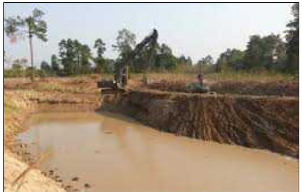
ภาพ : งานโครงการปรับปรุงและพัฒนาแหล่งน้ำตามนโยบายของคณะรักษาความสงบแห่งชาติ ที่ดำเนินการโดย กองทัพบก (ในส่วนของกองทัพภาคที่ 1) บริเวณคลองห้วยเกษียร ตำบลดงขี้เหล็ก อำเภอเมืองปราจีนบุรี จังหวัดปราจีนบุรี ระยะทางรวม 8,600 เมตร