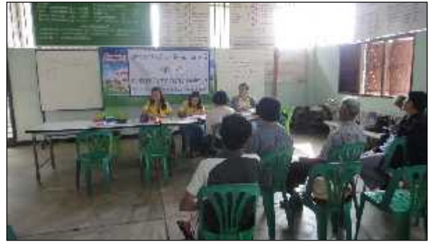
ภาพ : โครงการประชุมประชาคมเพื่อทบทวนแผนพัฒนาท้องถิ่น (58-60) ร่วมกับโครงการจัดเก็บภาษีนอกสถานที่ ประจำปี 2557

โดยเฉพาะด้านการบริการข้อมูลข่าวสาร ได้มีการเข้าพื้นที่จัดเก็บและดูแลเว็บไซต์ของ อบต. เพื่อประชาสัมพันธ์ข้อมูลข่าวสารผ่านระบบอินเทอร์เน็ต ได้มีการก่อสร้างศูนย์ข้อมูลข่าวสารทางราชการ เพื่อปิดประกาศประชาสัมพันธ์ ข้อมูลข่าวสาร และเพื่อให้ชุมชนได้รับรู้ถึงการปฏิบัติงานขององค์การบริหารส่วนตำบลได้ดำเนินการประชาสัมพันธ์ข่าวสารขององค์การบริหารส่วนตำบลผ่านสื่อกระจายข่าว โดยประชาสัมพันธ์ข่าวสารการดำเนินงานให้กับชุมชนอย่างสม่ำเสมอและต่อเนื่องเรื่อยมา