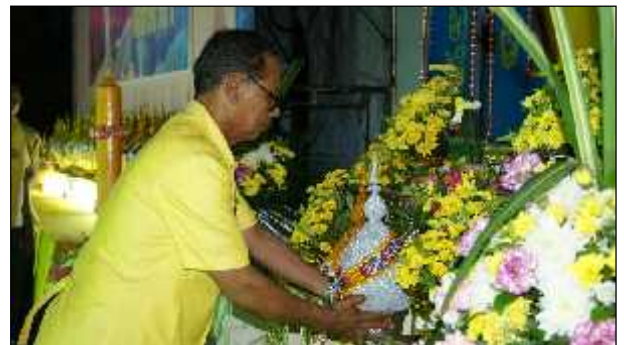
ภาพ : การกิจกรรมเดินเทิดพระเกียรติ และพิธีวางพานพุ่มสักการะเนื่องในวโรกาสวันเฉลิมพระชนมพรรษา พระบาทสมเด็จพระเจ้าอยู่หัวฯ ณ ลานพระบรมรูปรัชการที่ 5 อบต.ดงขี้เหล็ก ร่วมกับข้าราชการ พนักงาน พ่อค้าประชาชนในพื้นที่