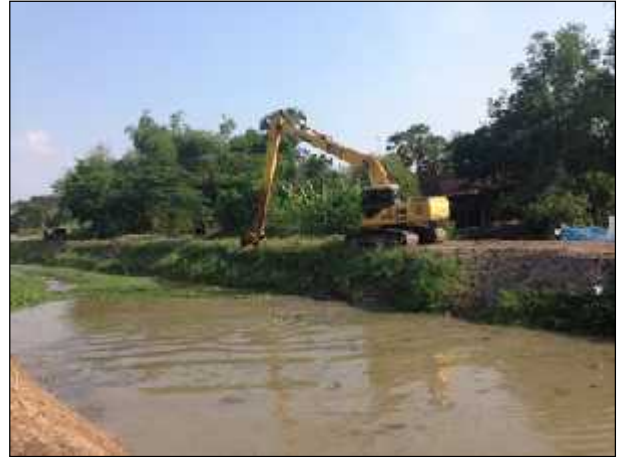
ภาพ : โครงการจ้างเหมารถแบ็คโฮขุดลอกคลอง กำจัดวัชพืช