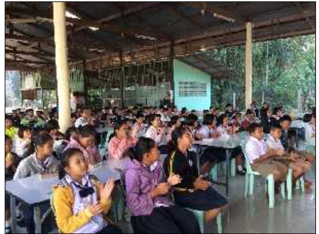
ภาพ : โครงการคลังสมองเพื่อพัฒนาศักยภาพด้านภาษา เด็ก และเยาวชนตำบลงิ้วเหล็ก 2557