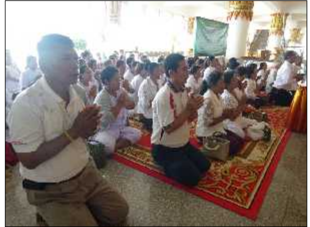
ภาพ : โครงการฝึกอบรมเพื่อพัฒนาศักยภาพผู้สูงอายุในพื้นที่ตำบลดงขี้เหล็ก ร่วมกับเจ้าหน้าที่จากโรงพยาบาลส่งเสริมสุขภาพตำบลทั้ง 2 แห่ง