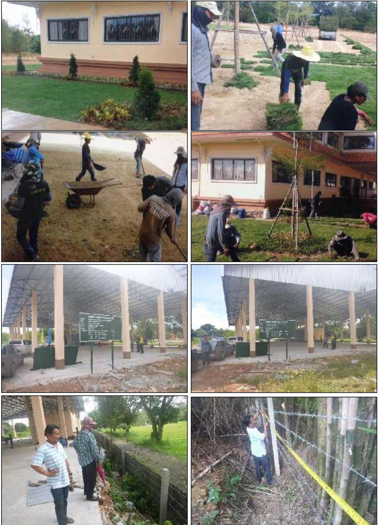
ภาพ : การตรวจรับงานโครงการต่างๆ ตามข้อบัญญัติ โครงการปรับภูมิทัศน์, โครงการก่อสร้างอาคารกึ่งพิพิธภัณฑ์, โครงการก่อสร้างอาคารจอดรถ, โครงการก่อสร้างรั้วรอบ ที่ทำการ อบต.หลังใหม่