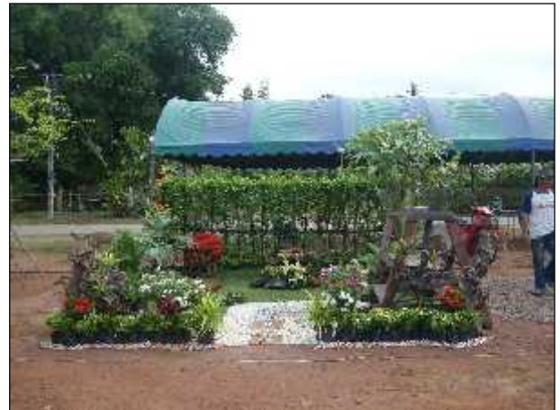
ภาพ : โครงการไม้ล้อม ไม้ใหญ่ พืชพรรณสมุนไพร บ้านดงบัง ประจำปี 2557