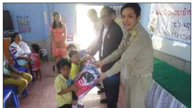
ภาพ : การมอบอุปกรณ์การเรียนการสอนศูนย์พัฒนาเด็กเล็กชุมชนบ้านดงบัง