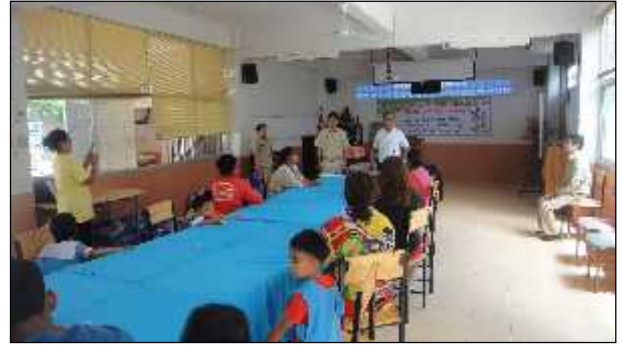
ภาพ : การมอบอุปกรณ์การเรียนการสอนศูนย์พัฒนาเด็กเล็กชุมชนบ้านขอนแก่น