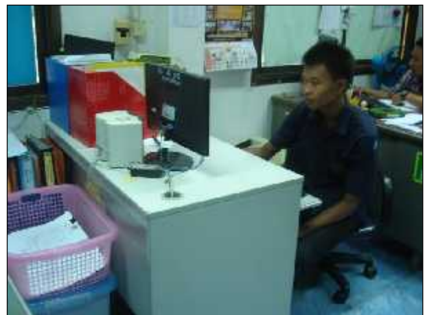
ภาพ : โครงการจ้างนักเรียน/นักศึกษาทำงานในช่วงปิดภาคเรียน