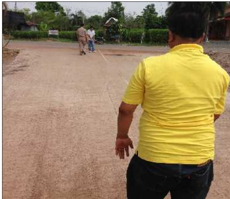
ภาพ : การตรวจรับงานโครงการก่อสร้างอาคารที่ทำการ และด้านโครงสร้างพื้นฐาน (ถนน)