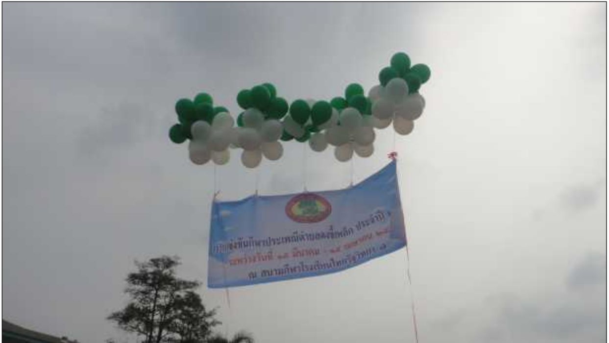
ภาพ : การจัดกิจกรรมการแข่งขันกีฬาประเพณีตำบลดงขี้เหล็ก ประจำปี 2557

ด้านการส่งเสริมศาสนาและวัฒนธรรม ได้ดำเนินการเพื่อการส่งเสริมศาสนาและวัฒนธรรมตามโครงการดังนี้ เพื่อเป็นการอนุรักษ์ประเพณีการรดน้ำขอพรจากผู้สูงอายุ และเพื่อเปิดโอกาสให้บุตรหลานได้มีโอกาสแสดงความกตัญญูและแสดงมุติเตาจิตต่อผู้สูงอายุ การดำเนินการอุดหนุนงบประมาณสภาวัฒนธรรมตำบลดงขี้เหล็ก เพื่อส่งเสริมการจัดกิจกรรมงานประเพณีอันเป็นการอนุรักษ์ประเพณีวัฒนธรรมท้องถิ่น การจัดกิจกรรมวันเฉลิมพระชนมพรรษาพระบาทสมเด็จพระเจ้าอยู่หัวฯและสมเด็จพระนางเจ้าฯพระบรมราชินีนาถ การร่วมกิจกรรมพระราชพิธีที่จังหวัดปทุมธานีจัดขึ้น ได้แก่กิจกรรมวันเฉลิมพระชนมพรรษาพระบาทสมเด็จพระเจ้าอยู่หัวฯและสมเด็จพระนางเจ้าฯพระบรมราชินีนาถ