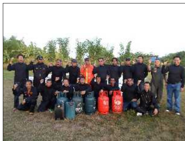
ภาพ : การฝึกอบรมตามโครงการอาสาสมัครดับเพลิงตำบลงิ้วเหล็ก

ซึ่งรายละเอียดโครงการที่ได้ดำเนินการไปแล้วในปีงบประมาณ พ.ศ.2557 ตามนโยบายที่ 1 มีดังนี้